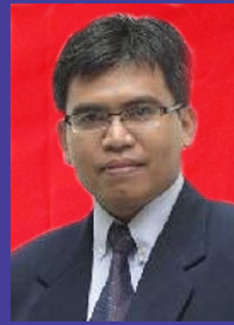
Supani, ST, MT, Ph.D* SEKRETARIS DEPARTEMEN TEKNIK SIPIL