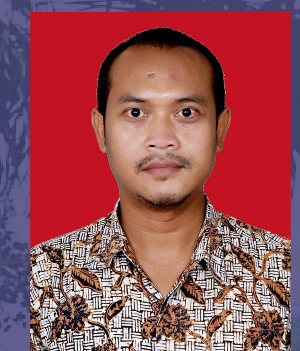
Istiar, ST, MT Sekprodi S1