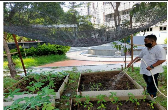
Kebun di Beberapa Departemen