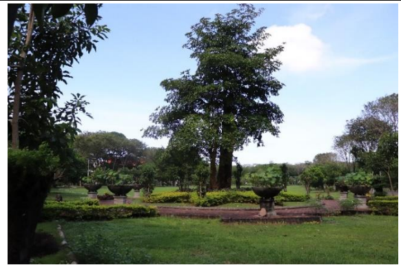
Tanaman di Taman Alumni ITS