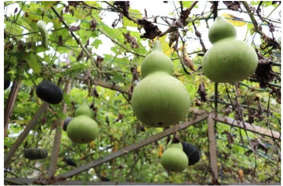
Sayur organik yang ditanam di urban farming ITS