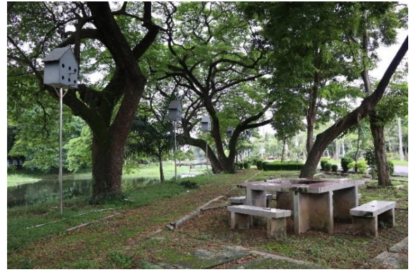
Taman di Departemen Statistika