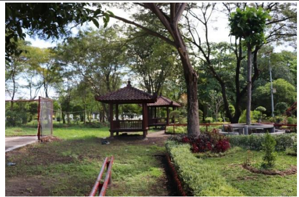
Tanaman di Departemen Teknik Mesin Industri (Vokasi)