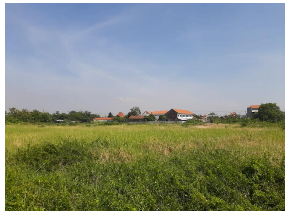
Lahan Kampus ITS yang digunakan untuk pertanian