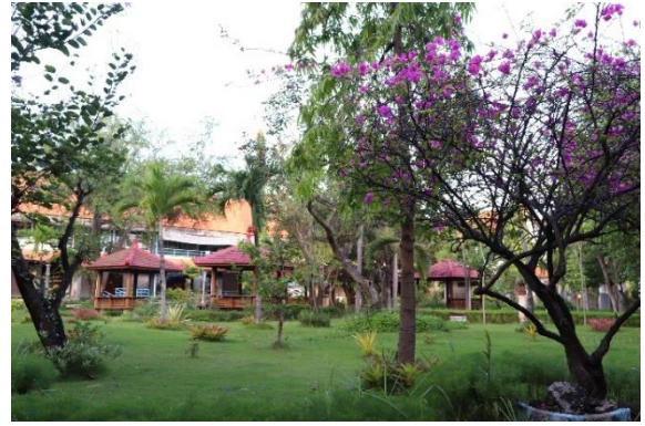
Taman di Departemen Teknik Sistem Perkapalan ITS