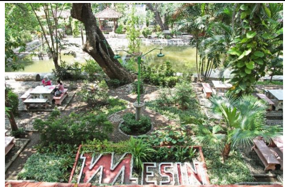
Taman di Departemen Teknik Mesin ITS