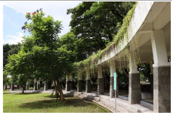
Taman Vertikal Perpustakaan