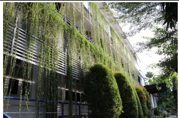
Taman Vertikal di Departmen Perencanaan dan Tata Kota