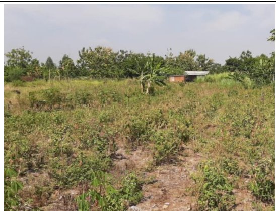
Lahan Kampus ITS yang digunakan untuk pertanian