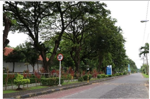
Taman di sepanjang jalan ITS