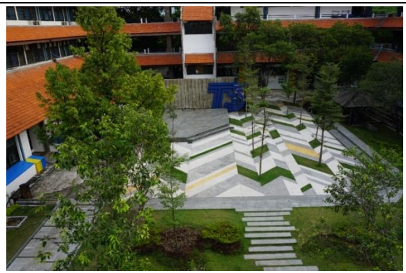
Taman dan vertical plant di Departemen Teknik Sipil