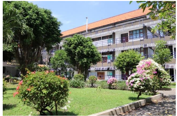
Taman di Departemen Teknik Lingkungan