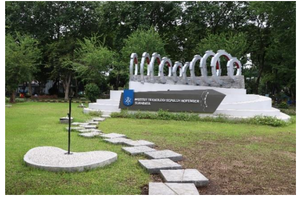
Taman Segitiga Kampus ITS