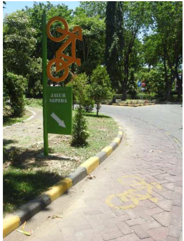
Jalur sepeda ITS