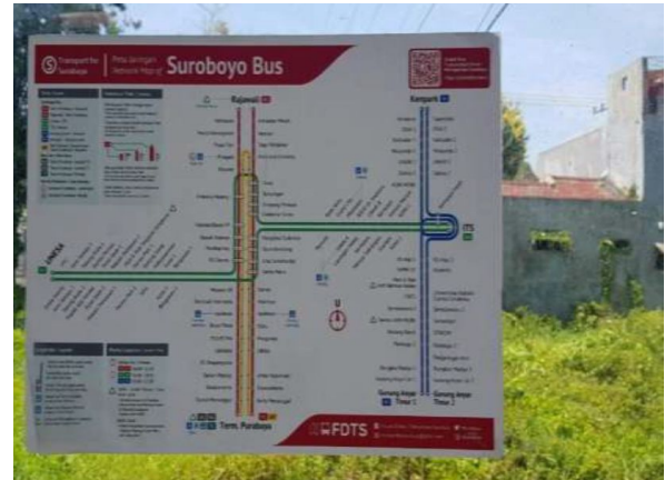
Bus Suroboyo dan Papan rute Bus Suroboyo yang melewati ITS