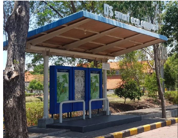
Shelter Bus Kampus ITS

Sepeda dapat digunakan oleh mahasiswa, tendik dan tamu di ITS. Peminjaman hanya dengan menyertakan kartu identitas dengan jam waktu tertentu sesuai dengan Standar Operasional Prosedur (SOP) yang telah ada.