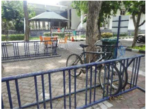
Bike Shelter Sepeda ITS