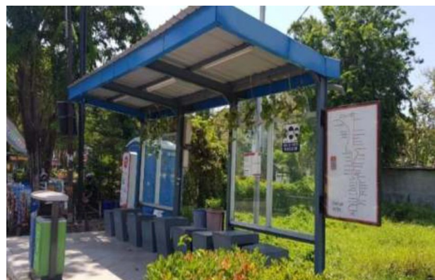
Bus Suroboyo dan Halte Bus yang terletak di depan kampus ITS