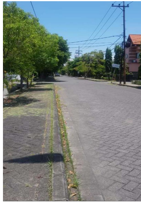
Penyediaan trotoar untuk pejalan kaki