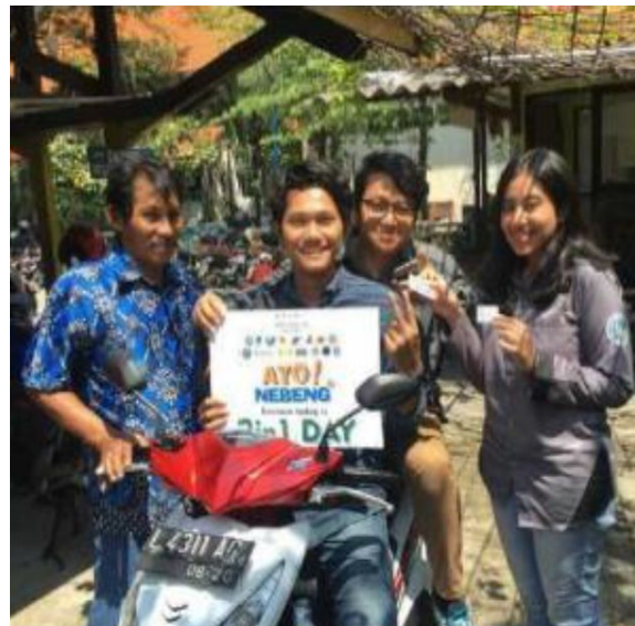
Program Ayo Nebeng 2in1 di ITS