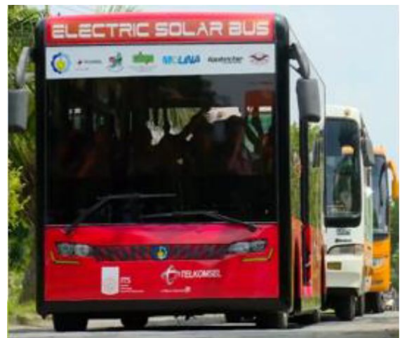
Bus Kampus ITS dan Electric Solar Bus ITS