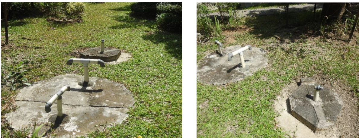
IPAL Departemen Teknik Mesin