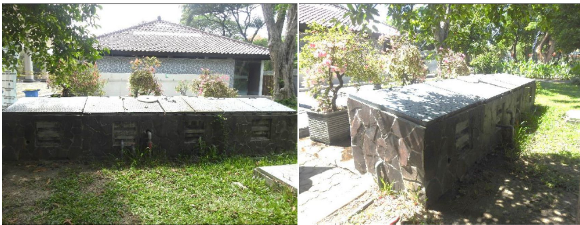
IPAL Masjid Manarul Ilmi