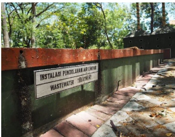
IPAL di Departemen Teknik Lingkungan