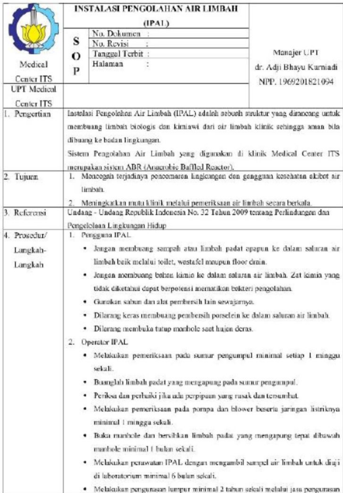
SOP Instalasi Pengolahan Air Limbah Medical Center ITS