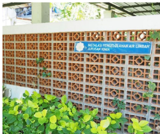
IPAL di Departemen Teknik Kimia