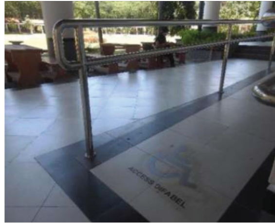
Jalur pedestrian ramah disabilitas yang dilengkapi fasilitas pegangan tangan