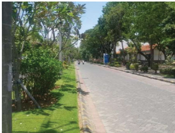
Jalur pejalan kaki dengan pemisah antara jalan kendaraan dan pejalan kaki