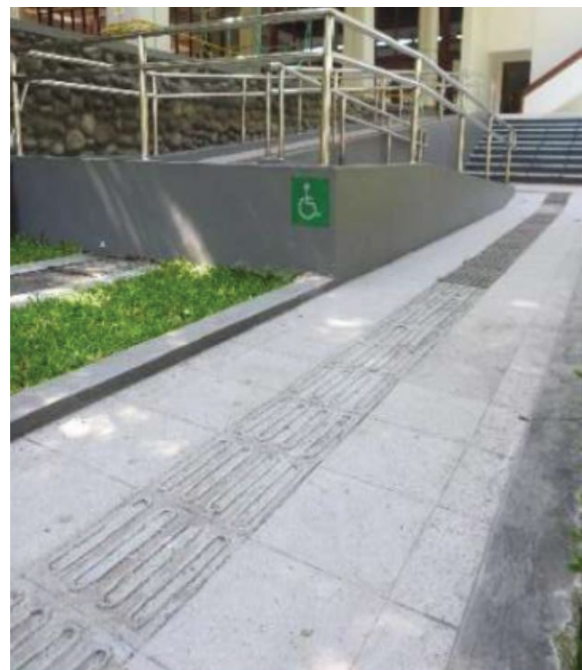
Jalur pedestrian dengan blok pemandu yang memudahkan pengguna disabilitas