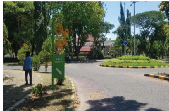
Petunjuk arah bagi pengguna trotoar, sepeda dan kendaraan bermotor