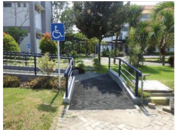
Jalur pedestrian ramah disabilitas dengan tanjakan pengganti tangga yang landai