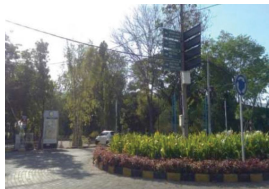
Fasilitas petunjuk arah untuk kenyamanan pengguna jalan