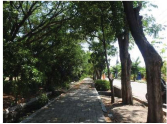
Jalur pedestrian yang rindang untuk kenyamanan pengguna jalan

Aspek jalur pejalan kaki yang ramah disabilitas di ITS meliputi: