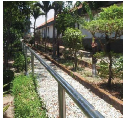
Fasilitas pejalan kaki yang dilengkapi pegangan tangan

Aspek kenyamanan jalur pejalan kaki di ITS diantaranya meliputi: