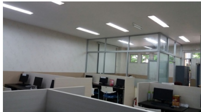
Gambar 6.2 Laboratorium Residensi S3 di Lantai 3

Pada tahun 2017, juga terdapat peremajaan spesifikasi komputer di Laboratorium Residensi. Di laboratorium residensi S2 sebelumnya 25 komputer dengan spesifikasi prosesor i3 memori 2GB sekarang sudah diupgrade menjadi 25 komputer dengan spesifikasi prosesor i5 memori 8GB. Data peralatan komputer Laboratorium Residensi Pascasarjana lantai 1 dapat dilihat pada Tabel 6.2. Karena jumlah mahasiswa S3 bertambah, Pascasarjana di DI juga membuka Lab Residensi S3 di lantai 3 (Tabel 6.3) dengan akses 24 jam. Berikut data peralatan di laboratorium residensi S3 Lantai 3.