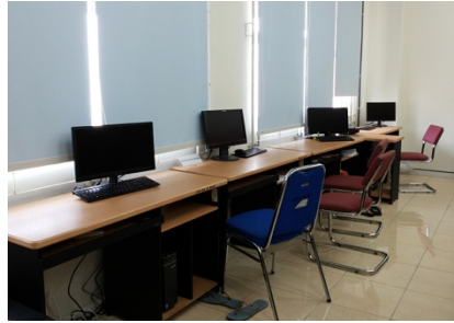
Gambar 6.1 Laboratorium Residensi S3 di Lantai 1