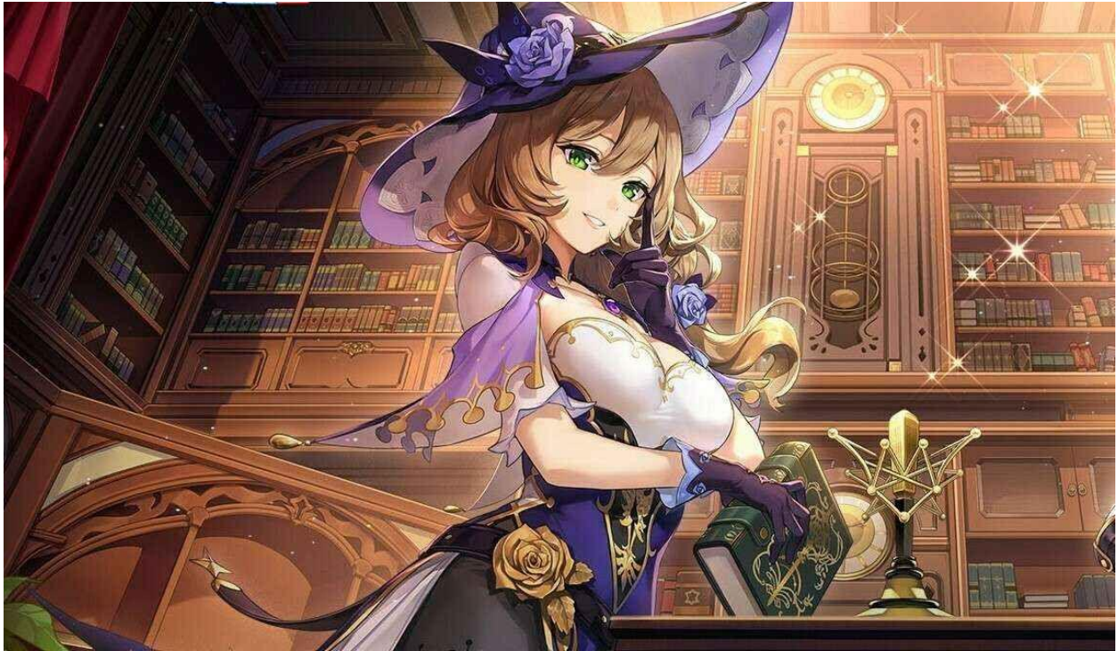
Pic : Lisa di perpustakaan knight of favonius