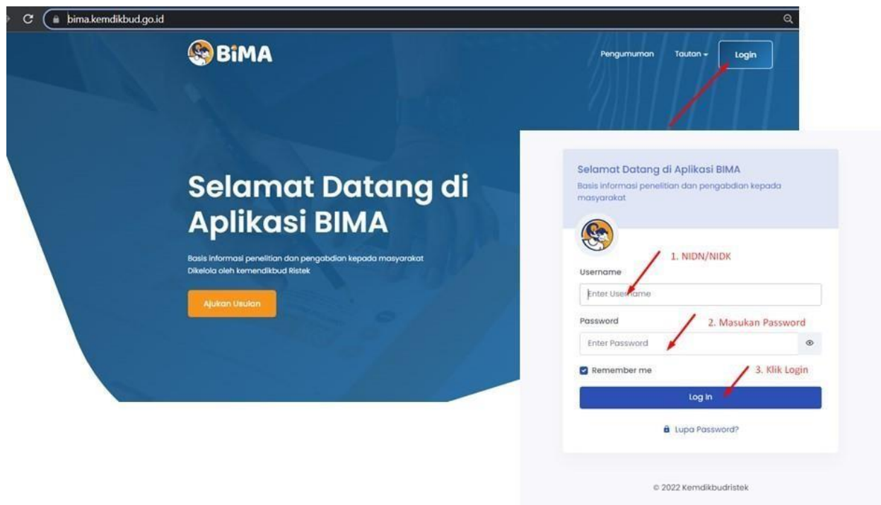
Gambar 1. Beranda akses memasuki aplikasi BIMA

Penerima pendanaan penelitian dan pengabdian kepada masyarakat di Perguruan Tinggi Penyelenggara Pendidikan Akademik Tahun Anggaran 2024 wajib melakukan revisi proposal, rencana anggaran biaya (RAB), dan mengunggah surat pernyataan kesanggupan pelaksanaan melalui aplikasi BIMA pada laman http://bima.kemdikbud.go.id/ dengan menggunakan akun ketua pengusul masing-masing, sebagaimana diperlihatkan pada Gambar 1.