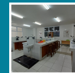
Lab Patologi Klinik