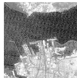
Gambar 2. Contoh Citra Input

Contoh Citra input dapat dilihat pada Gambar 2, yakni citra dari daerah Surabaya dari Band ke-5.