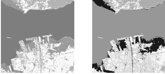
Gambar 3. Contoh Citra Output