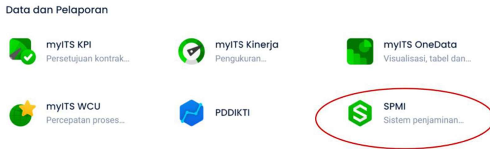
Gambar 3.1 Tampilan SSO MyITS untuk SPMI

Dalam melaksanakan SPMI penelitian ini, para auditee dapat memasukkan data dan informasi melalui sistem single sign on , MyITS pada fitur SPMI, yang terlihat di dalam Gambar 3.1 dan 3.2 di bawah ini.