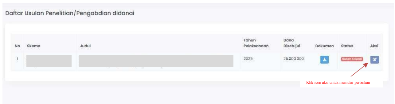
Gambar 3. Menu “Perbaikan Usulan” menampilkan daftar usulan yang harus diperbaiki

setelah itu memilih menu “Perbaikan Usulan” sehingga muncul daftar usulan yang dinyatakan didanai dengan status “Belum Selesai”, kemudian pilih tahun pelaksanaan 2026 sebagaimana diperlihatkan pada Gambar 3.